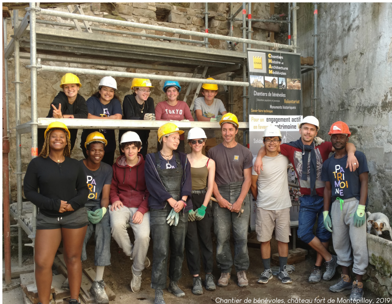
Chantier de bénévoles, château fort de Montépilloy, 2019

DRAC (Direction Régionale des Affaires Culturelles), DRJSCS (Direction Régionale de la Jeunesse, des Sports et de la Cohésion Sociale), UDAP (Unité Départementale de l'Architecture et du Patrimoine), DDCS (Direction Départementale de la Cohésion Sociale)