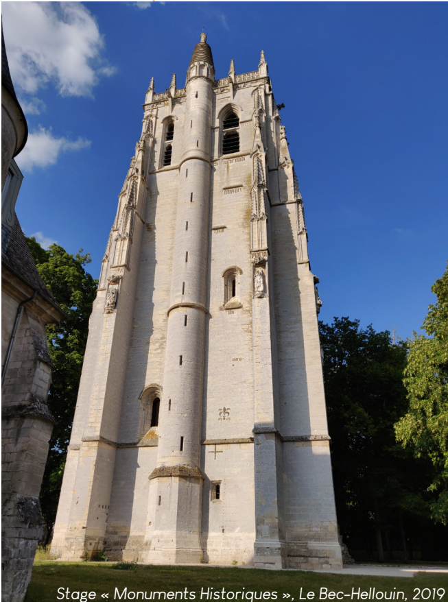
Stage « Monuments Historiques », Le Bec-Hellouin, 2019

valorisante , qu'ils peuvent ensuite mettre en avant dans leur recherche d'emploi ou d'une nouvelle formation.