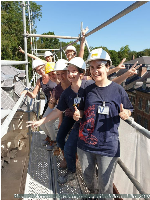
Stage « Monuments Historiques », citadelle de Lille, 2019

Différents types de chantiers sont organisés, en France métropolitaine et ultramarine et à l'étranger, qui correspondent à des publics différents :