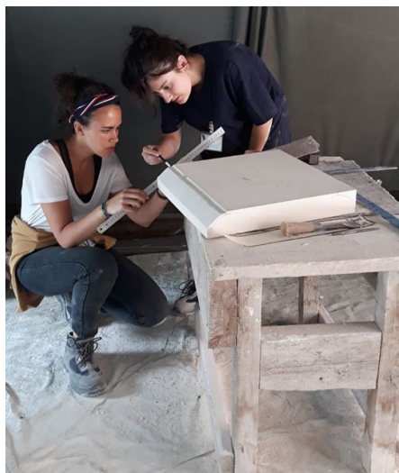
Stage « Monuments Historiques », Lille, 2019